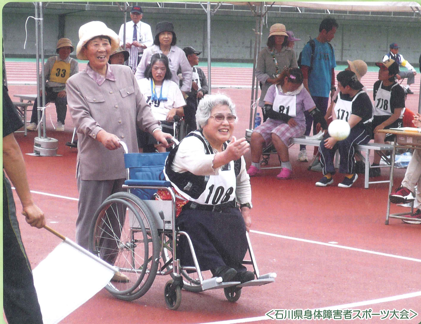
＜石川県身体障害者スポーツ大会＞