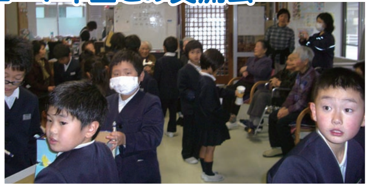
小木デイサービス