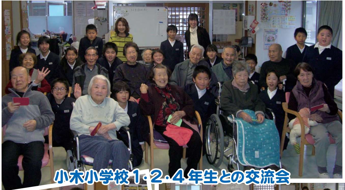
小木小学校1・2・4年生との交流会