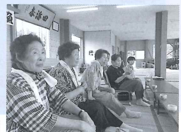
びなお楽しみ会での高齢者サロン事業