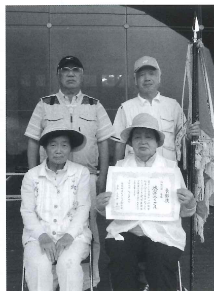
団体優勝の城山老人クラブAの皆さん