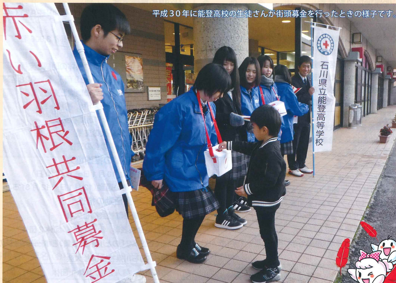
平成30年に能登高校の生徒さんが街頭募金を行ったときの様子です。